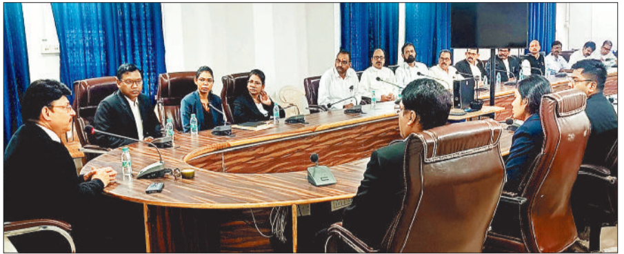
अधिवक्ता संघ की बैठक लेते न्यायाधीश।

की जरूरत है, ताकि यहां के लोग बारिश के दिनों में बादलों के गड़गड़ाहट के बीच आकाशीय बिजली से अपना बचाव कर सकें। साथ ही तड़ित चालक लगाए जाने की मांग भी ग्रामीणों द्वारा की जा रही है।