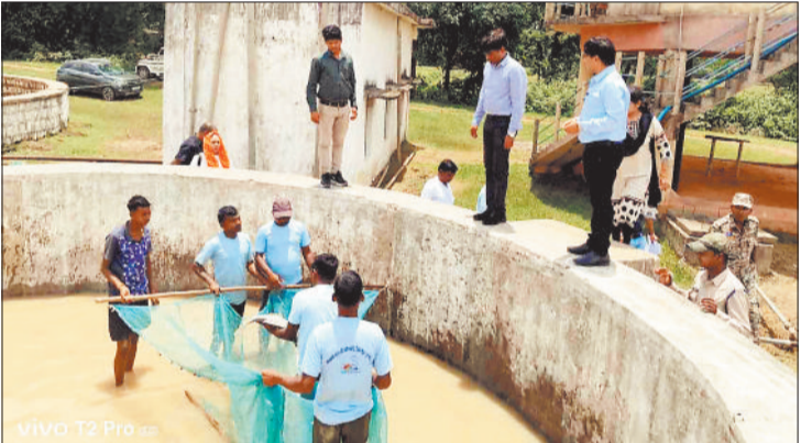
ग्रास कार्प, कामन कार्प मछलियों के वृद्धि हेतु कर से कम 1 से 1.50 किलो होने पर ही बाजार में विक्रय करें।