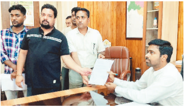
कलेक्टर को ज्ञापन सौंपते दुकानदार

हरिभूमि न्यूज ►► मनेन्द्रगढ़ भूपेन्द्र क्लब परिसर से हटाए गए प्रभावित दुकानदारों ने सोमवार को कलेक्टर को ज्ञापन सौंपकर अपने पुनर्वास की मांग की। दुकानदारों ने आग्रह किया कि उन्हें नगर के भीतर स्थित खाली शासकीय दुकानों में जल्द से जल्द स्थानांतरित किया जाए, ताकि वे फिर से अपने व्यवसाय की शुरुआत कर सकें और परिवार का भरण-पोषण कर सकें।