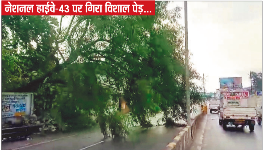
मनेन्द्रगढ़। लगातार बारिश के चलते नेशनल हाइवे क्रमांक 43 पर गुरुवार को एक विशालकाय पेड़ अचानक गिर पड़ा, इससे सड़क पर यातायात बाधित हो गया है। पेड़ के गिरने से वहां से गुजर रही बिजली लाइन भी टूट गई, इससे क्षेत्र में बिजली आपूर्ति बाधित हो गई है और बड़ी दुर्घटना की संभावना बनी हुई है। स्थानीय नागरिकों के अनुसार पेड़ गिरने के बावजूद वाहनों का आना-जाना जारी था, इससे कभी भी कोई गंभीर हादसा हो सकता था। आश्चर्य की बात यह है कि घटना की सूचना मिलने के बाद भी बिजली विभाग के अधिकारी काफी देर तक मौके पर नहीं पहुंचे।

मनेन्द्रगढ़। जिले में मानसून ने जोर पकड़ लिया है और लगातार हो रही बारिश से खेतों में हरियाली की उन्मील प्रखर हो गई है। भू-अभिलेख विभाग द्वारा जारी आंकड़ों के अनुसार बाँते 24 घंटे में जिले में औसत 1.5 मिमी बारिश दर्ज की गई है, जबकि भरतपुर तहसील में अब तक की सर्वाधिक 366.7 मिमी वर्षा दर्ज की गई है। 11 जून से 9 जुलाई तक जिले में कुल औसत 297.3 मिमी वर्षा भू-अभिलेख शाखा द्वारा दर्ज की गई है, जो खरीफ फसलों की बोआई के लिए अनुकूल मांगी जा रही है। भू-अभिलेख शाखा के अनुसार तहसीलवार वर्षा की बात करें तो मनेन्द्रगढ़ में 246.1 मिमी, खड़गावां में 295.9 मिमी, चिरमिरी में 335.7 मिमी, केल्लारी में 213.2 मिमी, भरतपुर में 366.7 मिमी और कोटाडोल में 326.1 मिमी बारिश दर्ज की गई है।