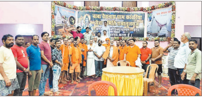
पहले जत्थे का स्वागत करते समिति के पदाधिकारी व सदस्य।