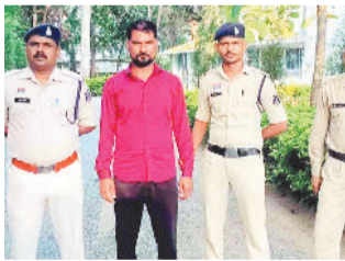
मार्ग से झारखंड की ओर जा रहे है। सूचना पर पुलिस ने तत्काल नाकाबंदी की। इसी बीच

प्रतापपुर। मवेशी तस्करी कर रहे एक युवक को पुलिस ने गिरफ्तार किया है जबकि तीन चालक वाहन छोड़ मौके से फरार हो गए। पुलिस ने 3 लाख 60 हजार कीमत के मवेशी व 18 लाख कीमत के वाहन जब्त किया है। अवैध कार्यों पर पूर्णतः अंकुश लगाने के निर्देश पर क्षेत्र में गश्त कर रहे चंदौरा पुलिस को मुखबिर् से सूचना मिली कि भटागांव की ओर से तीन पिकअप एवं एक कार से बड़ी संख्या में दुस-दुसकर मवेशी भर कर बनारस