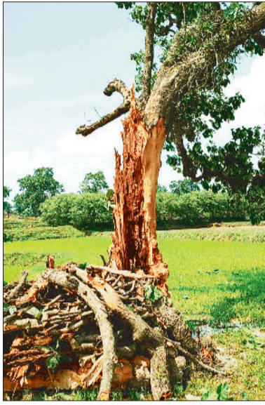
आकाशीय बिजली की चपेट में आया पेड़।

कोरिया जिले में वैसे तो प्रतिवर्ष बरसात के सीजन में मानसून आने साथ बारिश ही नहीं बल्कि आसमान से बरसती बिजली का खोफ भी लाता है, लेकिन जिले के सोनहत ब्लाक का कई क्षेत्र बरसात के दिनों में आकाशीय बिजली गिरने की ज्यादा घटनाएं होती हैं। सोनहत ब्लाक का ग्राम लटमा में प्रतिवर्ष आकाशीय बिजली गिरने की घटना होती है, जो लटमा गांव की भौगोलिक स्थिति और संभवतः यहां के विभिन्न वायुमंडलीय हालात ग्राम लटमा में आकाशीय बिजली के लिए एक असामान्य रूप से संवेदनशील क्षेत्र बनाते हैं। प्रतिवर्ष मानसूनी सीजन में यहां के निवासियों के लिए बादलों की गड़गड़ाहट सिर्फ मौसम के बदलाव का नहीं बल्कि जीवन के लिए खतरों की घंटी भी बजाता है। ऐसे में ग्राम लटमा